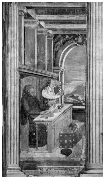
Anonimo, Petrarca compone l'Africa, il poema incentrato sulle vicende antecedenti Zama, Padova, ca. 1375