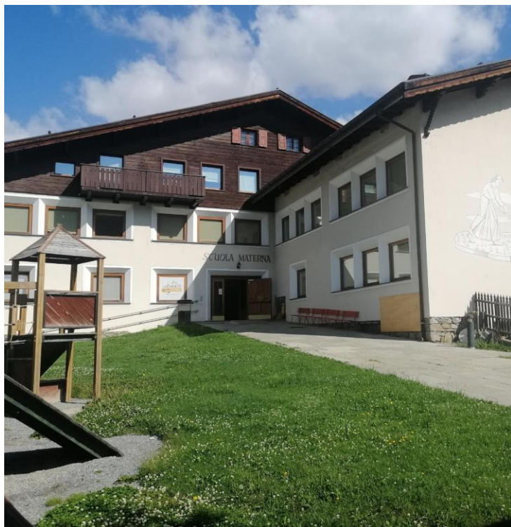
SCUOLA DELL'INFANZIA S.MARIA