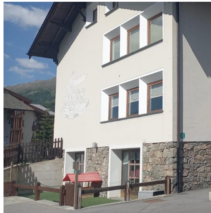
NIDO D'INFANZIA S.MARIA