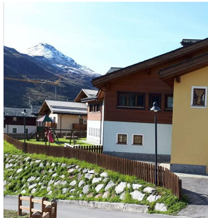
SCUOLA DELL'INFANZIA S.ANNA TREPALLE

SCUOLE DELL'INFANZIA FISM – SONDRIO GESTIONE DAPPRIMA RELIGIOSA E POI LAICA