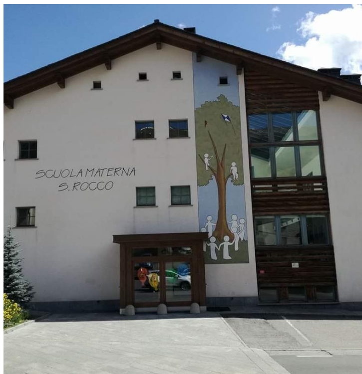
SCUOLA DELL'INFANZIA S.ROCCO