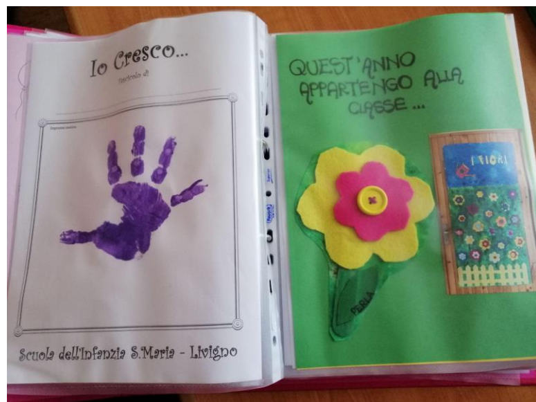
IL FASCICOLO PERSONALE DEI BAMBINI