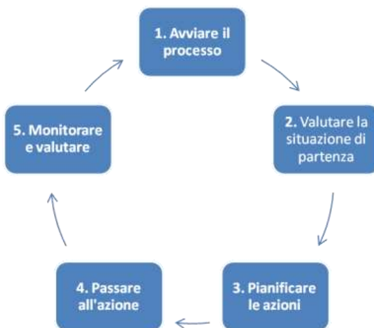
Diagramma 1. Le fasi chiave di un approccio scolastico globale per diventare e/o rimanere una scuola che promuove salute.

La Comunicazione e la Valutazione sono due componenti di questo processo su cui è utile riflettere e lavorare in ciascuna fase.